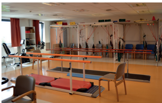
Salle de kiné